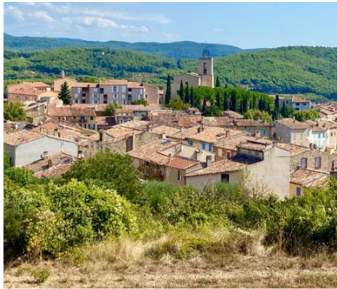
Les villages provençaux À partir de 20 min