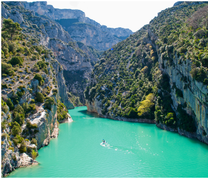
Les Gorges du Verdon À partir de 40 min