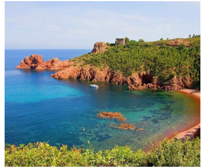
L'Estérel À partir de 40 min